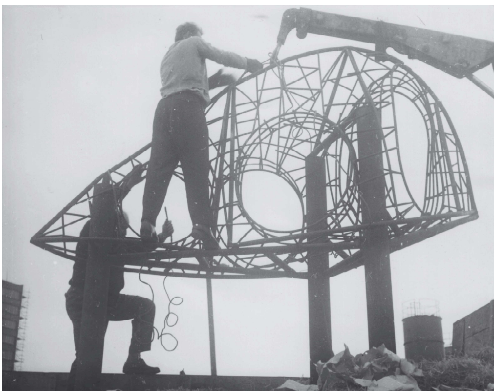
Obr. 6 Fotodokumentace práce na sochařském díle v pozůstalosti autora – dětská prolézačka Pavla Hanzelky pro Ostravu Hrabůvku, 1966–1969. Soukromý archiv Veroniky Žufánkové, pozůstalost Pavla Hanzelky.