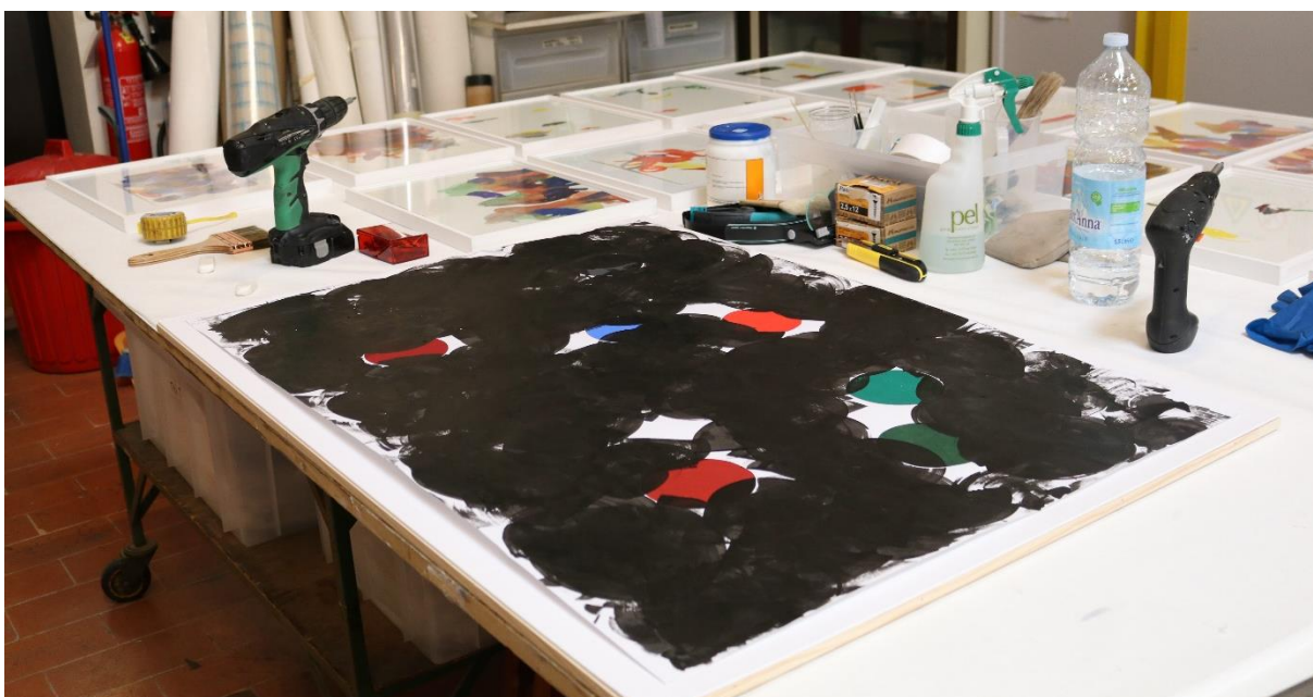
Adjustování děl od Milana Grygara