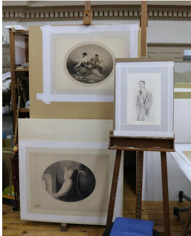
Restaurování souboru děl od Louise Icarta