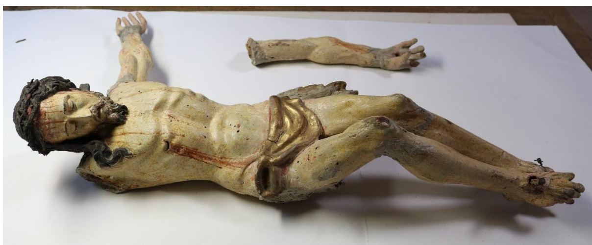
Polychromovaná soška Krista – po sejmutí nepůvodní polychromie