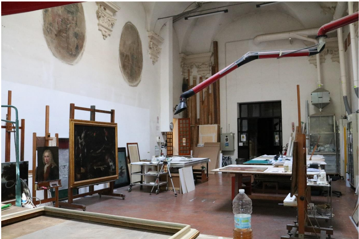
Pracoviště – hlavní ateliér