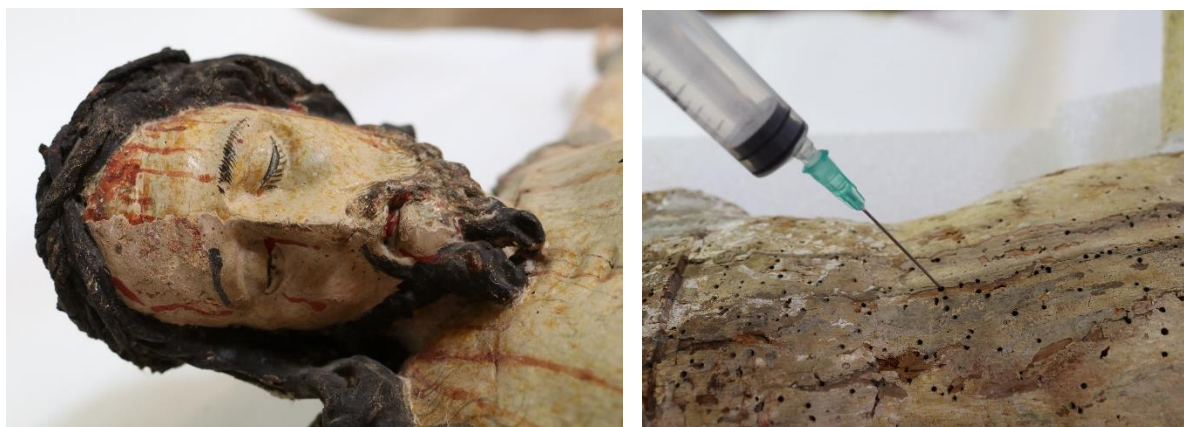
Polychromovaná soška Krista – snímání nepůvodní polychromie, konsolidace