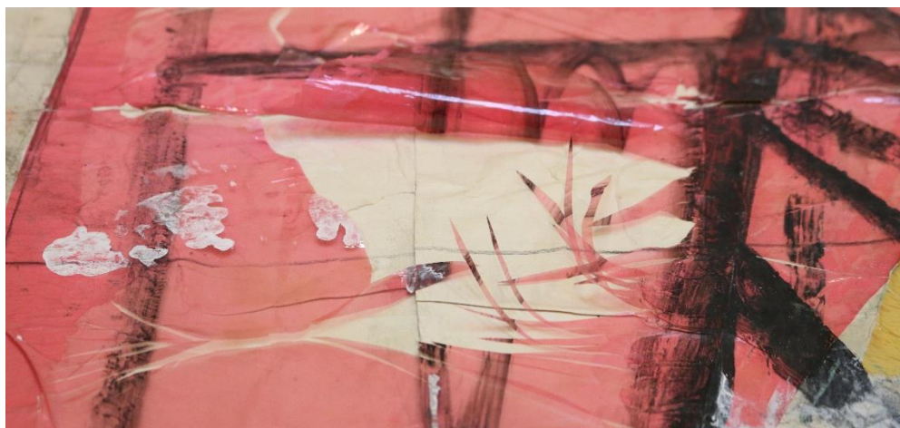
Přípravná skica pro vitráž od Bruno Saetti – detail trhliny