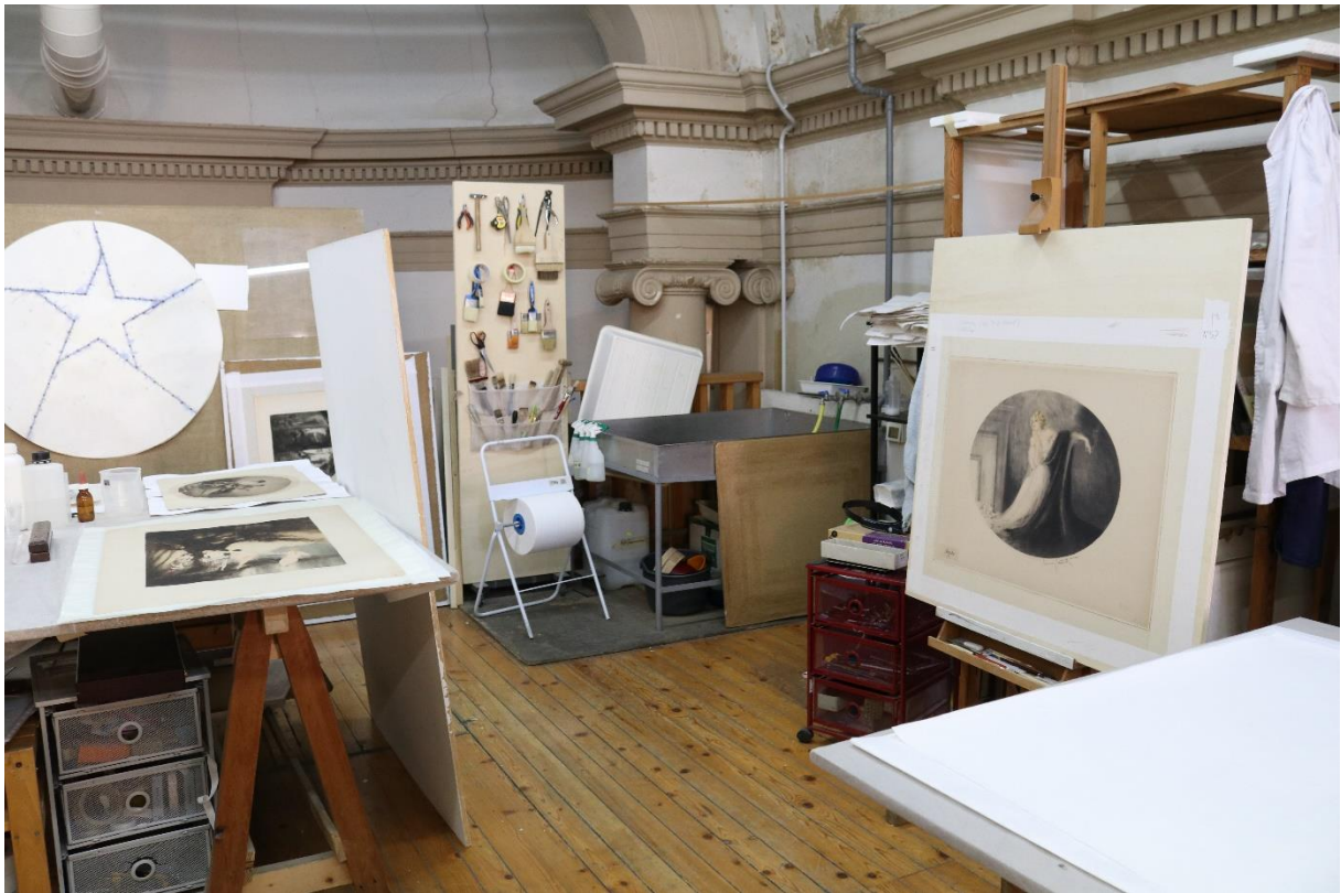
Pracoviště pro restaurování papíru