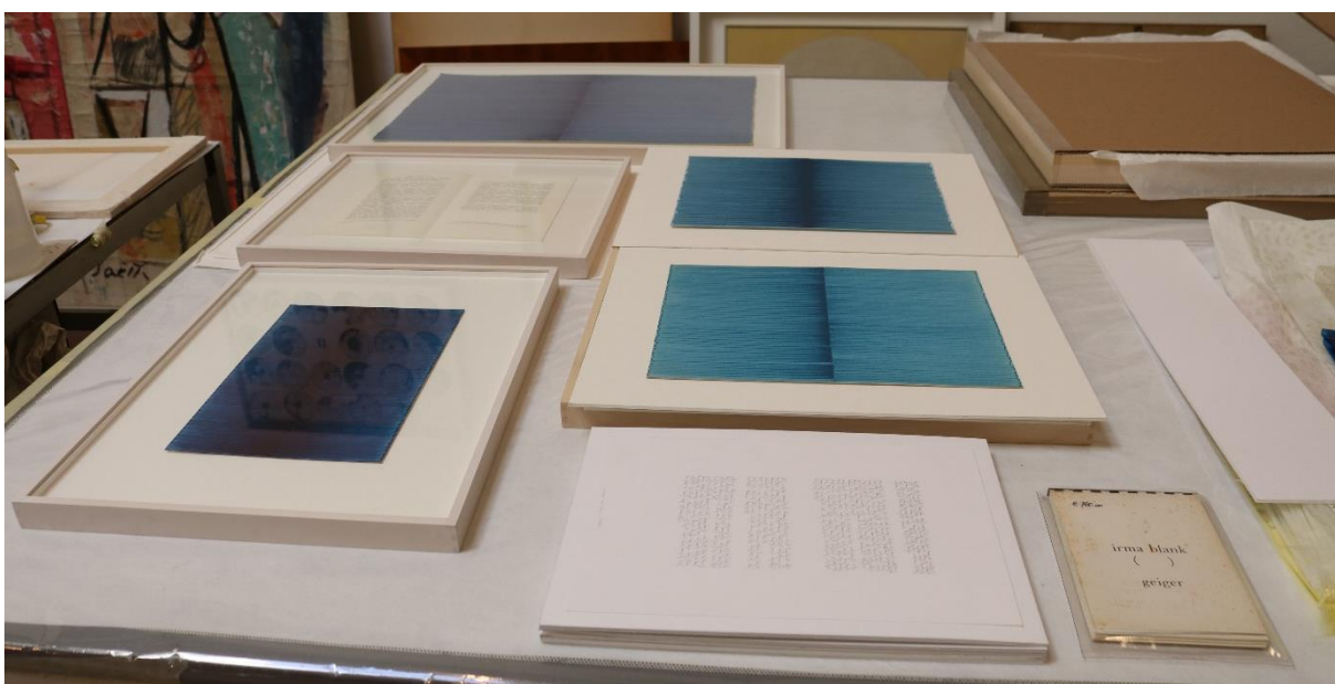
Adjustování děl od Irmy Blank