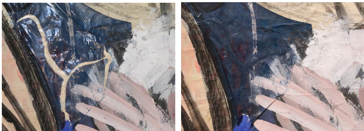
Přípravná skica pro vitráž od Bruno Saetti – detail opravy trhlin