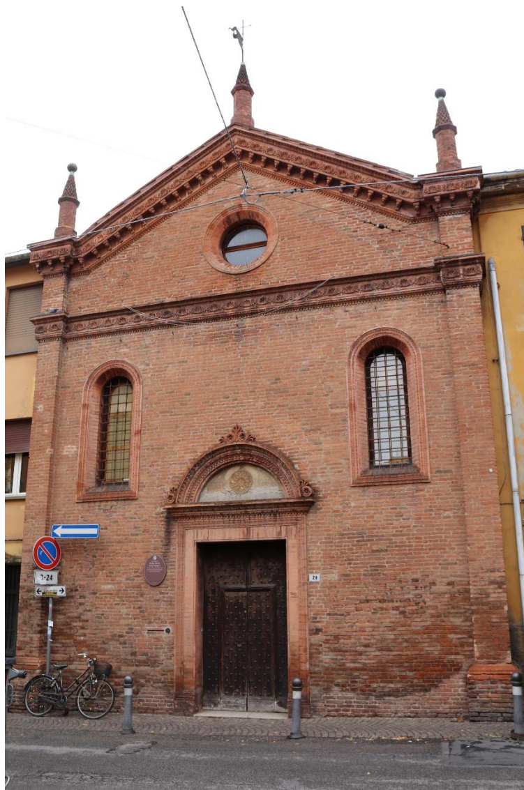
Laboratorio degli Angeli S.r.l. – pohled na pracoviště z venku