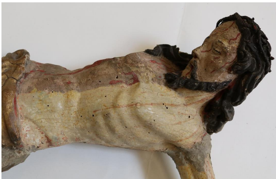
Polychromovaná soška Krista – snímání nepůvodní polychromie