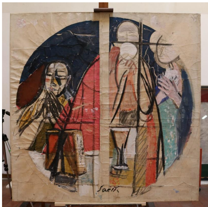
Přípravná skica pro vitráž od Bruno Saetti