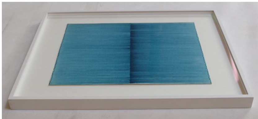
Adjustování děl od Irmy Blank – z líce