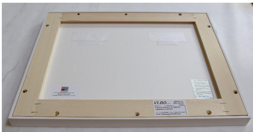
Adjustování děl od Irmy Blank – z rubu