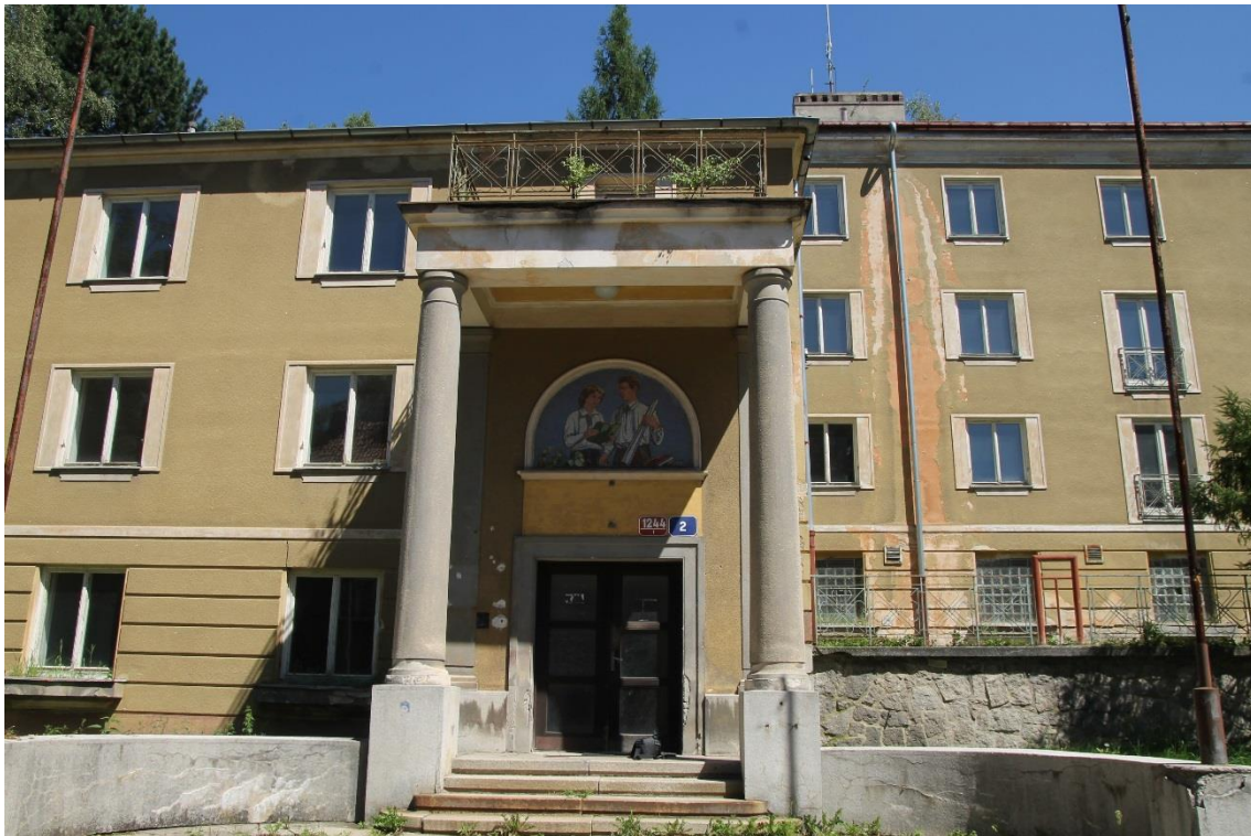
Umístění mozaiky nad vstupem do bývalého internátu v Třebízského ulici.