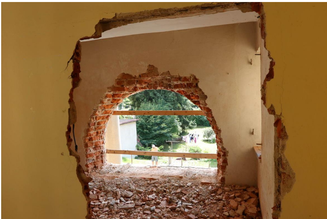
Pohled na místo původního umístění mozaiky z interiéru budovy. Mozaika musela být pro nedostatek manipulačního prostoru pod klenbou vstupu vyjmuta ze zadní strany odbouráním části stěny.