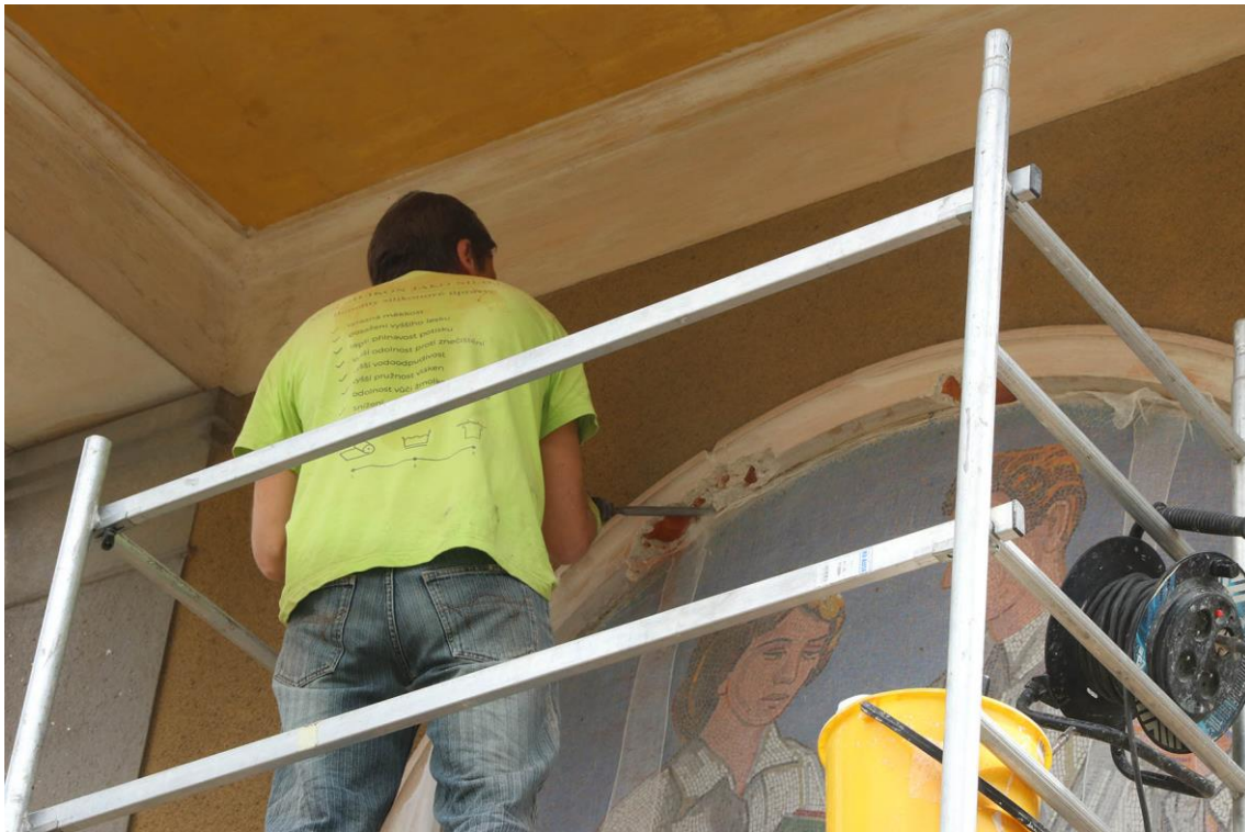
Snímání mozaiky zajištěné gázovými přeplepy.